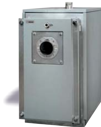
Inox Cond 110 Cond

Передняя дверь котла, в которую устанавливается горелка, открывается в обе стороны. Это очень удобно при обслуживании горелки. Уплотнение двери выполнено из плетеного стекловолокна в два слоя. Внутренняя поверхность двери покрыта слоем огнеупорного материала. Для визуального контроля пламени в двери предусмотрено смотровое окно с огнеупорным стеклом. Теплообменник котла изолирован слоем стекловаты, стекловолокна и алюминия. Корпус и обшивка - листовая сталь. Возможна установка котлов в каскад при заказе соответствующей автоматики. Котлы CE сертифицированы в соответствии с Директивой Gas 90/396/CEE и Директивой Rendimenti 92/42/CEE