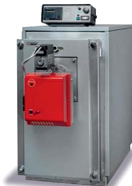
GTS Inox Cond 110 Cond

При установке специальных модулей, подключаемых к главному контроллеру, возможно управление контуром солнечных панелей или другим альтернативным источником тепла, а также удаленная диспетчеризация котла с помощью сети Интернет.